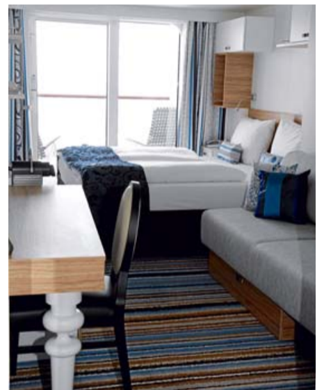
■ Gelungenes Design: Das nagelneue Schiff bietet überraschende Perspektiven, viel Licht, hochwertige Materialien und viele Deko-Akzente.