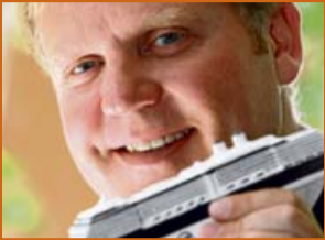
Von Jörg A. Boeckmann www.cruceros.es www.kreuzfahrten-ab-palma.es

Besuch an Bord der „Mein Schiff 3“, die an diesem Sonntag in Palma ihre Jungfernfahrt beendet hat