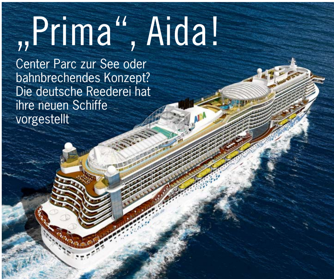
■ Ab 2015 mit senkrecht abfallendem Bug auf dem Weltmeeren unterwegs: die „Prima“.

Auch kulinarisch ändert sich einiges. Zu den bekannten Buffet-Restaurants und dem Steak-Haus kommen bei den insgesamt 13 Restaurants nun auch Service-Restaurants hinzu, in denen wohl ohne Aufpreis Sitzplatz-Reservierungen möglich sind. Weiterhin warten das French Kiss und das Casanova als Spezialitäten-Restaurants. Speziell für Familien konzipiert ist das Buffet-Restaurant Fuego. Für den schnellen Hunger und als belebter Treffpunkt gedacht ist die neue Plaza mit der Heißen Ecke und anderen Fast Food-